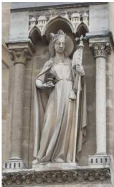
Statua di Maria Maddalena a Notre Dame

Oggi, 15 aprile, mancano 101 giorni alla fine di quest'anno della Luna Cosmica Rossa, che si concluderà con il Kin 13 nel Giorno Fuori dal Tempo, il 25 luglio 2019 (unisciti a noi a Teotihuacan, in Messico!).