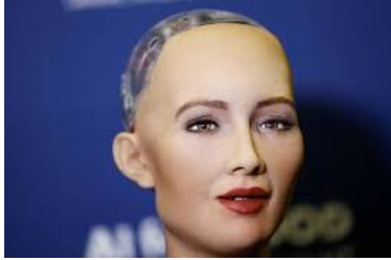
Sophia, il primo cittadino robot (Arabia Saudita)

Allo stato attuale, l'Intelligenza Artificiale appare irreversibile e ben più avanzata di quanto si possa immaginare. È nei satelliti nello spazio, è incorporata nei nostri sistemi computerizzati e in laboratori sotterranei di tutto il mondo e in un sacco di altri luoghi. C'è anche una nuova religione dell'Intelligenza Artificiale, Way of the Future (La Via del Futuro) . Sophia è il primo robot a cui è stata concessa la cittadinanza in Arabia Saudita, e sta creando la sua moneta. A Dubai è operativo primo robot ufficiale di polizia. Il business dei sex bot (robot del sesso, NdT) cresce in maniera esponenziale. Bill Gates sta creando una Smart City nel deserto dell'Arizona in cui a guidare le vetture sono i robot, e l'Arabia Saudita sta costruendo Neom, una città più grande di Dubai in cui ci sono più robot che esseri umani.