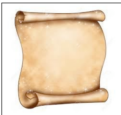
Il Rotolo senza iscrizioni (Ezechiele, 33:33 )

Nella tradizione tibetana esistono i cosiddetti rotoli gialli (anche se le pagine sono di vari colori, si chiamano così). Essi contengono spesso scritti simbolici e sono contenuti in scrigni ornati da gemme preziose, fatti di legno, argilla o pietra. Talvolta uno scrigno contiene scritti simbolici di molti insegnamenti, e gli scritti di un solo insegnamento sono divisi in diversi contenitori.