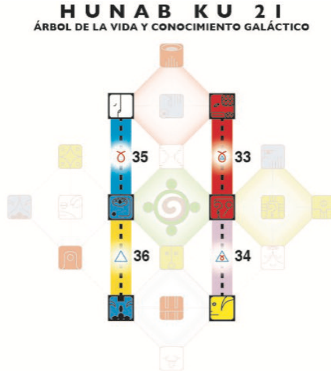
MOSTRANDO LOS SENDEROS DE LAS HEPTADAS 33-36

Nel viaggio di 52 settimane attraverso i 52 Sentieri delle Eptadi dell'Albero Galattico della Vita e della Conoscenza di Hunab Ku 21, durante la Luna Solare si attivano i seguenti Sentieri: